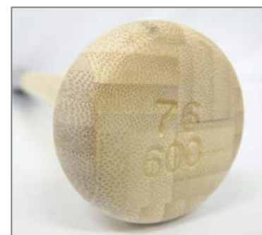
竹バットの構造(グリップエンド)